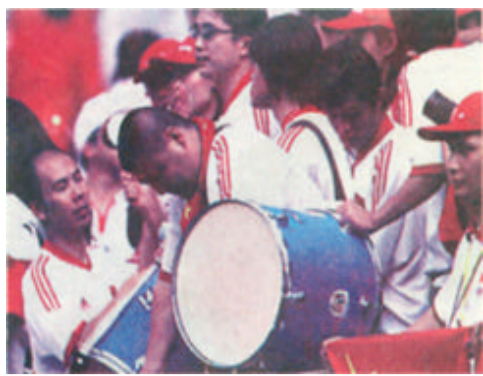
沮丧的中国球迷助威团