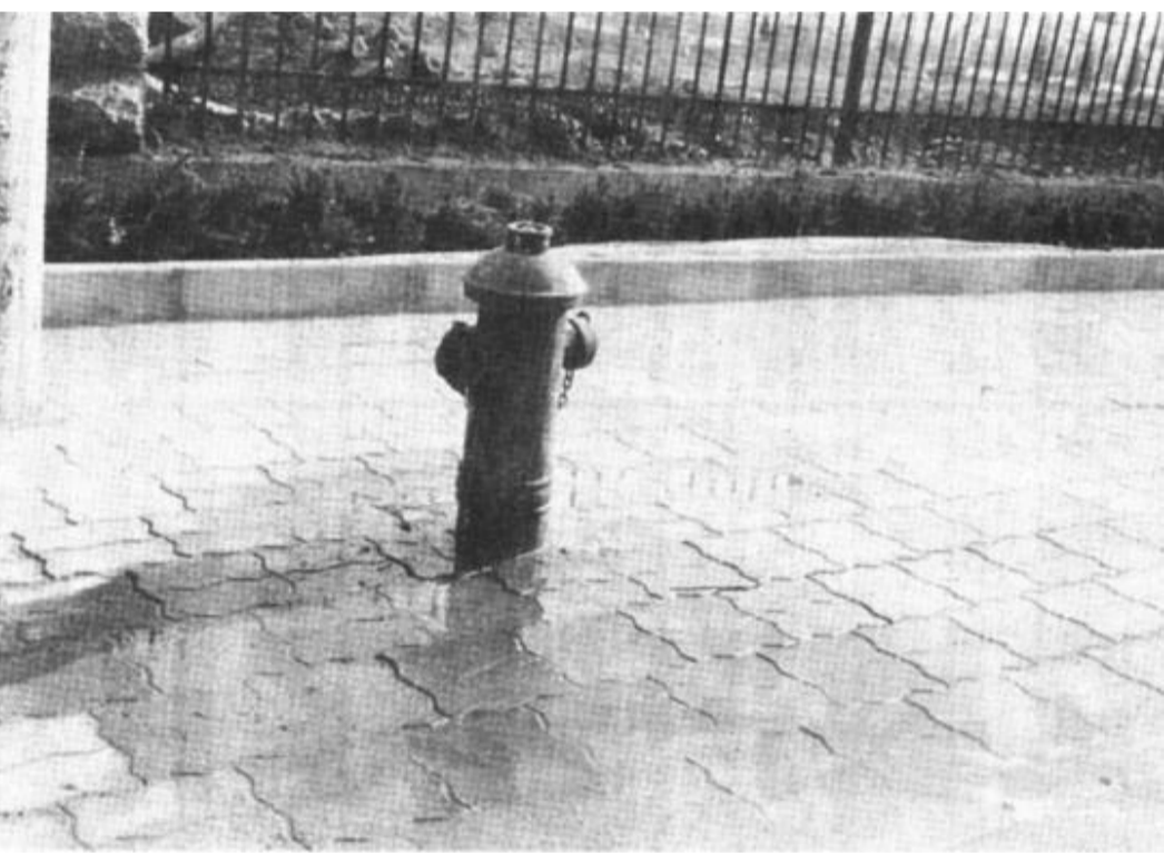
位于东城某居民小区里边的这个消防栓已经这样默默流淌了一个多月了。虽然只是滴水,可每天消防栓下边都有一大片是湿的,有时候还能沾着柏油路面与人行步砖硬化面接口处形成一二十米长的清沟小溪。听熟悉情况的人介绍说,是前一段时间周围一处绿化带施工时有人在消防栓里边取过水,后来没有关严,从消防栓取水绿化似乎是在明令禁止之列,而用后不关,破坏了环境浪费了水,就更不应该了。

位于东城某居民小区里边的这个消防栓已经这样默默流淌了一个多月了。虽然只是滴水,可每天消防栓下边都有一大片是湿的,有时候还能沾着柏油路面与人行步砖硬化面接口处形成一二十米长的清沟小溪。听熟悉情况的人介绍说,是前一段时间周围一处绿化带施工时有人在消防栓里边取过水,后来没有关严,从消防栓取水绿化似乎是在明令禁止之列,而用后不关,破坏了环境浪费了水,就更不应该了。