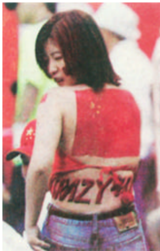
中国女球迷穿肚兜助阵惊艳全场