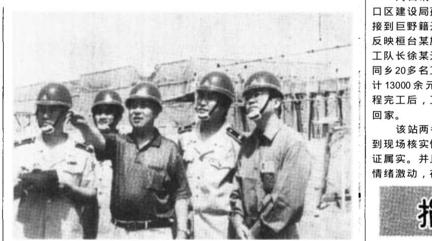
河口区建设局经常进行建筑工程安全和质量检查。图为区建设局的工作人员正在与仙河广厦房地产开发有限责任公司的总经理

呼吸、有机肥发酵及沼气燃烧为蔬菜提供二氧化碳气肥,促进光合作用。这样,在同一个日光温室里,实现了产气、积肥同步,种植、养殖并举,充分利用了生物能和太阳能,建立起种养沼密切结合的良性循环生态系统。“四位一体”模式不仅有效解决了冬季沼气池产气少、猪生长慢的难题,而且为充分利用秸秆、粪便等废弃物资源,发展优质无公害蔬菜,提高大棚的综合利用率找到了新的出路。 (李波 李花芳 李洁)