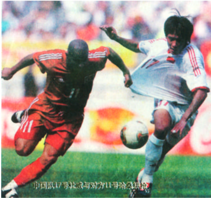
中国队17号球员与对方11号球员拼抢