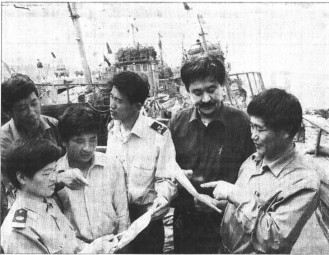
东营区广利港社区把安全生产当作重中之重来抓。为所有渔船及岸上指挥中心配备了多频道无线通讯对讲设备，随时相互传递天气预报、生产生活情况及预先求助等信息。同时他们还组织专业技术人员，利用休渔期对渔船进行了全面检修。并与各船长签定了安全生产责任书，确保渔业安全生产。

日前，记者来到山东横店草业畜牧有限公司在我的生产现场采访。一眼望不到边的大地上翠绿一片，首蓆等优质牧草严严实实地覆盖在昔日寸草不生的原野上。横店草业两亿元的投资，已效果初现。 而他们的战略构想更为宏伟：计划在“十五”期间，以东营为中心，发展黄河三角洲连片大规模集约化首蓆种植和畜牧产业一体化，并带动当地农户生产240万亩首蓆草及相关乳、肉产品，引领广大农民致富。可以说，横店草业已经成了盐碱地上的一面“绿色旗帜”。透析山东横店草业做大做强的实践，展望他们未来发展之路，对于我们适应加入WTO后的新形势，加快农业龙头企业发展的有着很强的借鉴意义。 立足高起点 要当世界“草王” 成立于1999年的山东横店草业畜牧有限公司，是由国家农业产业化龙头企业——横店草业有限公司与香港中宏有限公司合资组建的现代化农业企业。 它落户东营，正值我市“大开放、大招商、大发展”战略如火如荼之时。人们期待着横店草业能为黄河三角洲这片土地增添新的活力。但它的奋斗目标“振兴民族草业，争做世界草王”，的确让许多人瞪大了眼睛。但横店草业对他们的事业胸有成竹，因为他们对国内外草业发展形势有着清醒认识。现代草业所蕴含的无限商机，让横店人无法漠视、无法平静。 世界各国都十分重视人工牧草的生产。许多国家均以首蓆作为农牧业支柱产业。据统计，全世界首蓆总种植面积为3300万公顷，仅美国就种植首蓆1186万公顷。同时，优质人工牧草具有巨大的国际市场潜力，特别是亚洲市场，首蓆